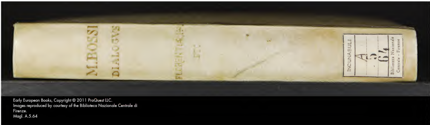
Magl. A.5.64